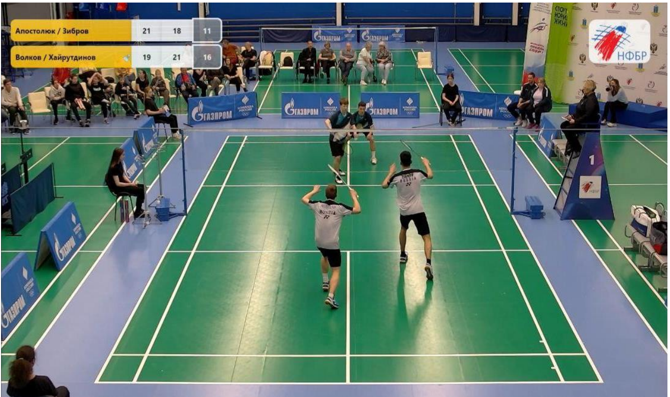
Рисунок 2. Пример кадра ТВ корта. Основная камера