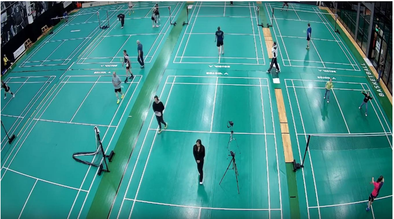
Рисунок 1. Пример кадра общей камера игрового зала